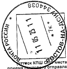
Оттиск КПП ОПС места приема почтового отправления)